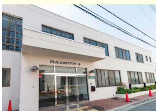
OSJとよなかケアスクール

事業内容：介護福祉士養成施設の運営、日本語教育機関の運営、登録支援機関、職業紹介事業