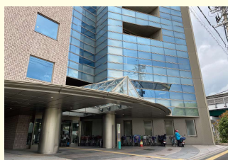
OSJ日本語アカデミーとよなか