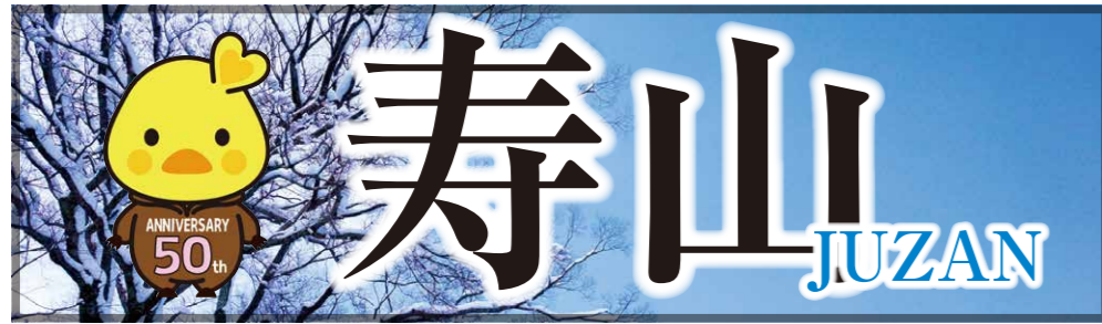
マスコットキャラクター 五月ちゃん