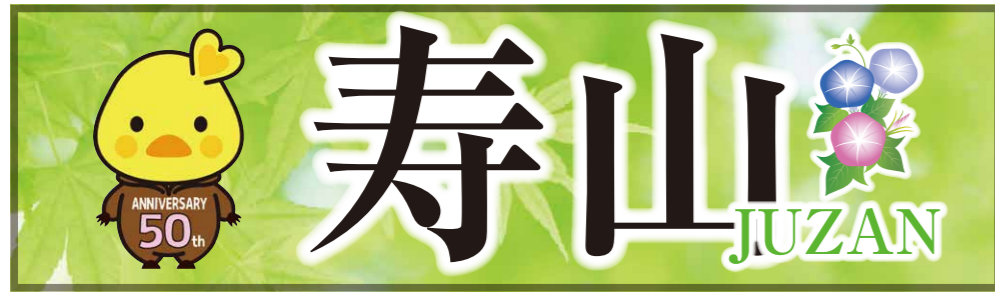
マスクキャラクター 五月ちゃん