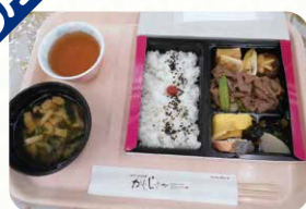
すき焼き幕の内弁当